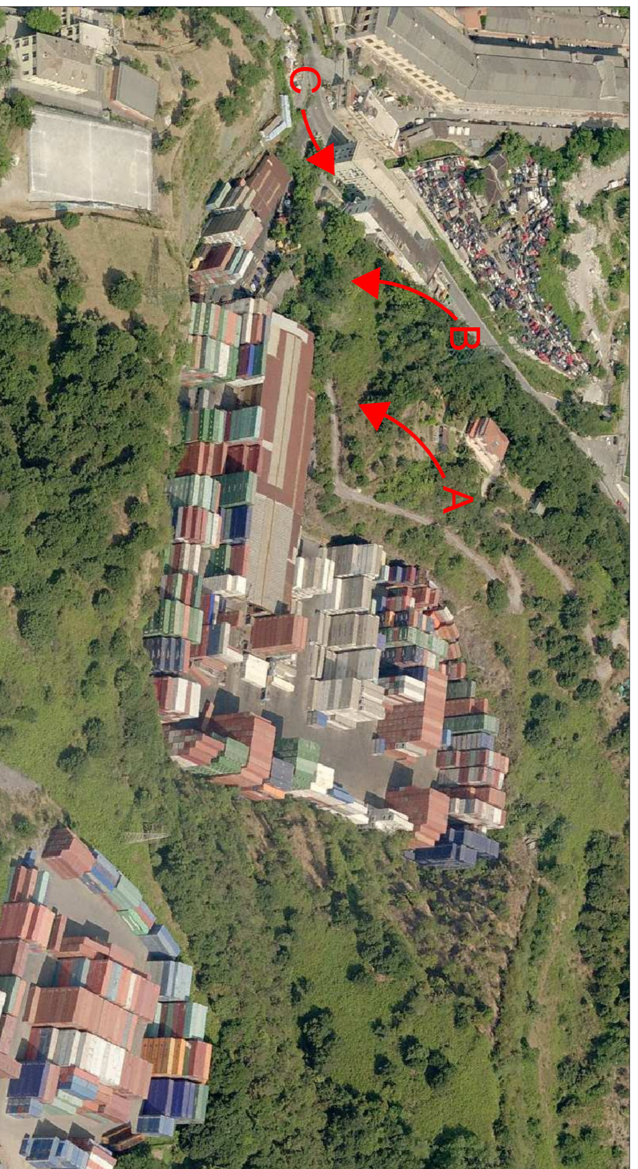
1 Stato di fatto - vista aerea prospettica

LEGENDA FOTO A : Capannone riparazioni meccaniche B : Palazzina uffici C : Capannone riparazioni container