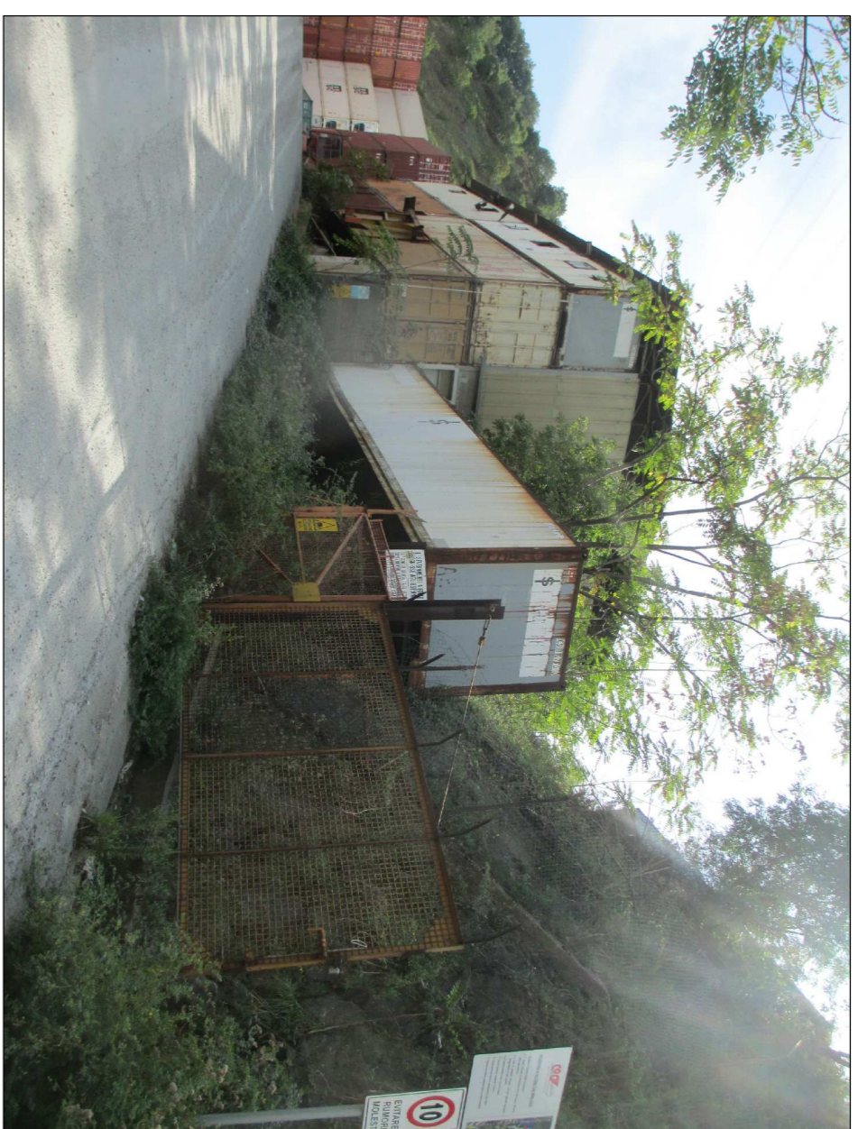
A Stato di fatto - capannone riparazioni meccaniche - viste