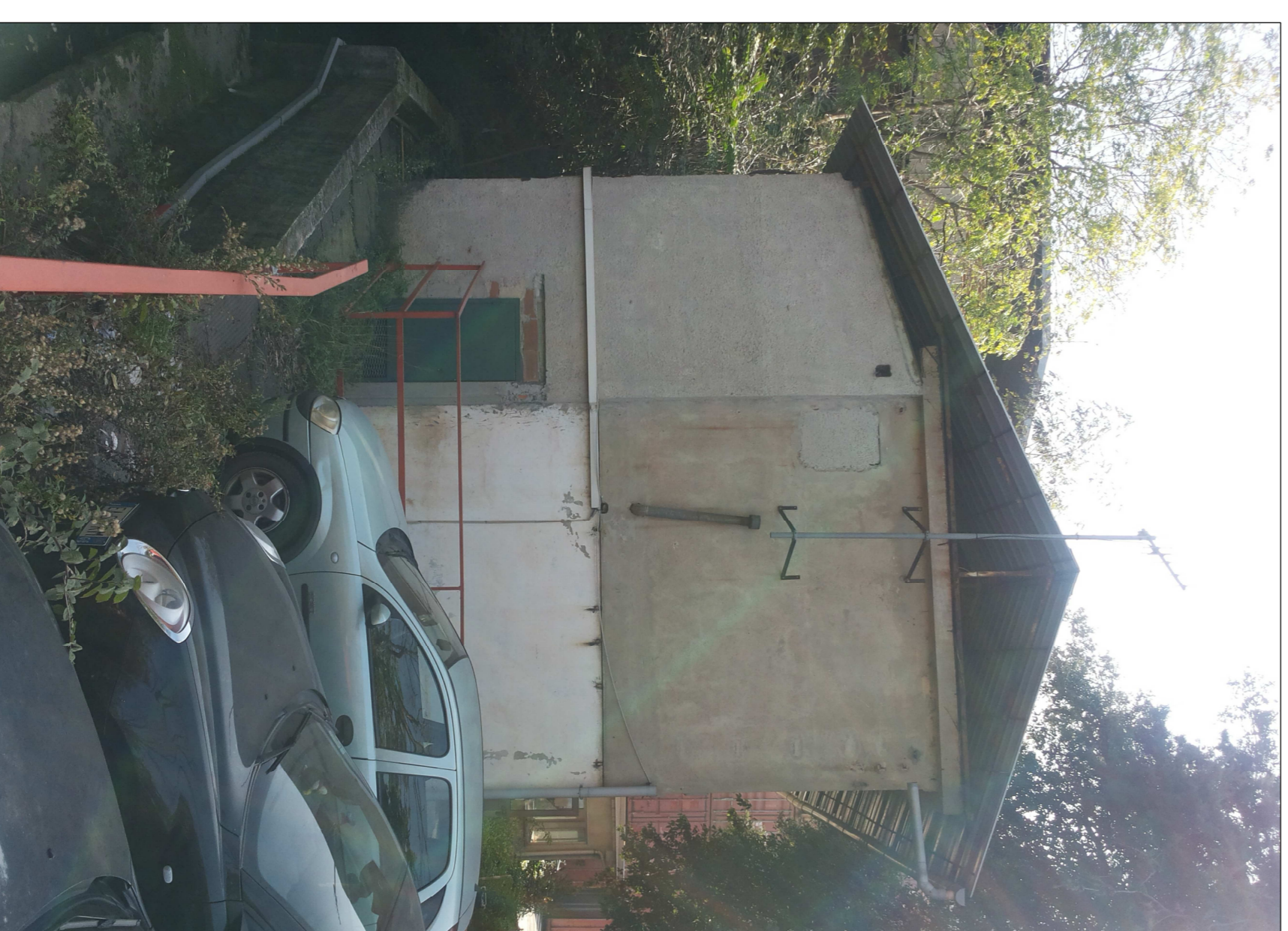
B Stato di fatto - palazzina uffici - viste